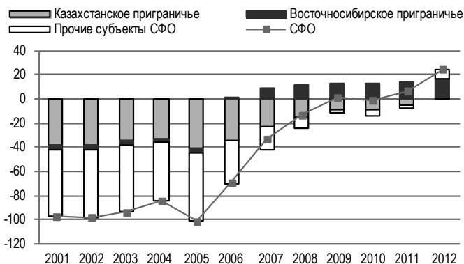
Рис. 1. Естественный прирост (убыль) населения в СФО по отдельным группам территорий, 2001–2012 гг., тыс. чел.

Начиная с 2006 г. на территории Сибирского федерального округа, как и России в целом, наметилась позитивная тенденция быстрого сокращения естественной убыли населения и выхода на положительный естественный прирост (рис. 1). Это связано как с общим улучшением ситуации в результате оживления экономики, так и с повышенным вниманием, оказанным демографической и социальной сферам, а также со структурными факторами. Однако на территориях Казахстанского приграничья эта тенденция проявляется с запаздыванием и не такими темпами, как в прочих субъектах СФО, и особенно в Восточносибирском приграничье, которое уже с 2006 г. вышло на положительный естественный прирост населения в целом и в 2007 г. – во всех субъектах.