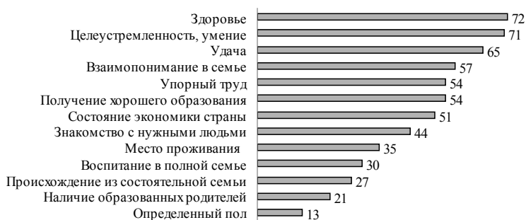
Рис. 2. Доля жителей Новосибирской области, считающих, что параметр очень важен для повышения материального положения, 2010 г., %

Более четко дифференциация в восприятии населением важности рассматриваемых факторов проступает, если обратиться к доле тех, кто определил тот или иной параметр как очень важный (рис. 2).