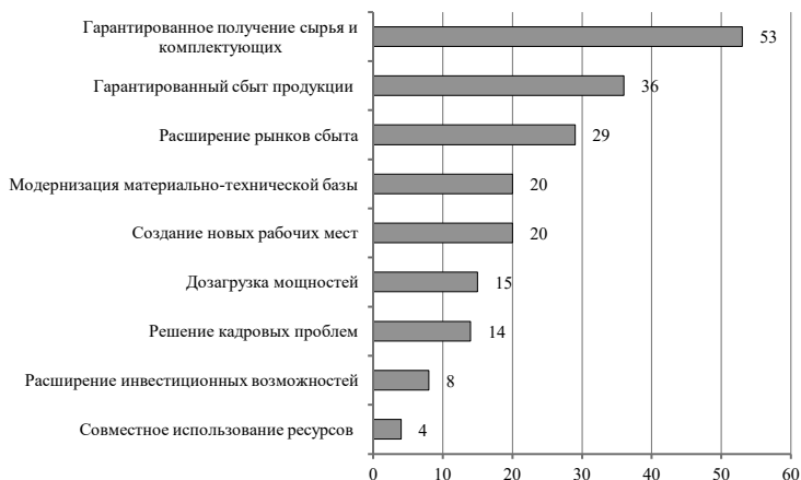
Рис. 1. Мотивы участия в кооперационно-сетевых взаимодействиях, % к числу предприятий, участвующих в кооперации (по данным опроса руководителей)

Мотивы участия в кооперации заметно варьируют в зависимости от вида экономической деятельности. Для аграриев наиболее важны гарантированный сбыт продукции и модернизация материально-технической базы; для организаций, занятых строительством, а также транспортировкой и хранением продукции – расширение их инвестиционных возможностей.