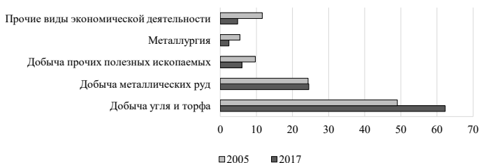
Рис. 2. Вклады отраслей в образование отходов в 2005 г., 2017 г., %

Примечательно, что при добыче сырой нефти и природного газа отходов почти не образуется (менее 1% от суммарного объема). Однако, с нашей точки зрения, из-за особенностей статистического учета, экологический вред от данного вида деятельности, в том числе – в области образования отходов, сильно недооценен. Сегодня буровые растворы классифицируются как сточные воды, хотя по степени воздействия на окружающую среду их логичнее считать жидкими отходами. Вред наносится как от проникновения нефтепродуктов в почву и грунтовые воды, так и в виде испарений в атмосферу. Например, с одного только Туймазинского нефтегазового месторождения в атмосферу попадает до 123 т нефтепродуктов ежегодно [Ладыгин и др., 2018].