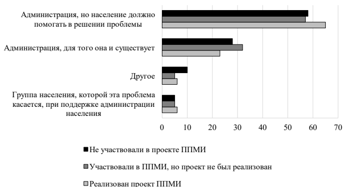
Рис. 2. Ответы респондентов на вопрос: «Кто и как должен решать проблемы Вашего поселения, чтобы они решались по возможности быстро и эффективно?», % от числа опрошенных