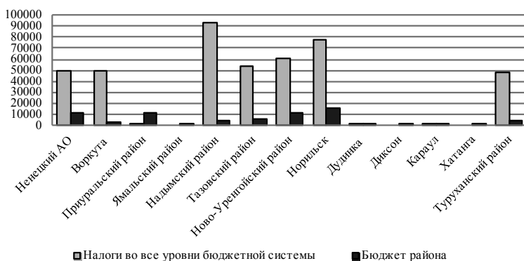
Рис. 2. Соотношение перечисленных налогов во все уровни бюджетной системы и остающихся в распоряжении районов, 2011 г., млн руб.

Сектор «Государственное управление». В соответствии с государственной политикой по централизации доходов бюджета на федеральном уровне арктические территории перечислили более 436 млрд руб. во все уровни бюджетной системы, в их распоряжении остался лишь 71 млрд (16% доходов) (рис. 2). Конечно, в данном исследовании не охвачены другие платежи и трансферты населению районов из федеральных и региональных бюджетов – тогда расходная часть могла бы быть и выше.