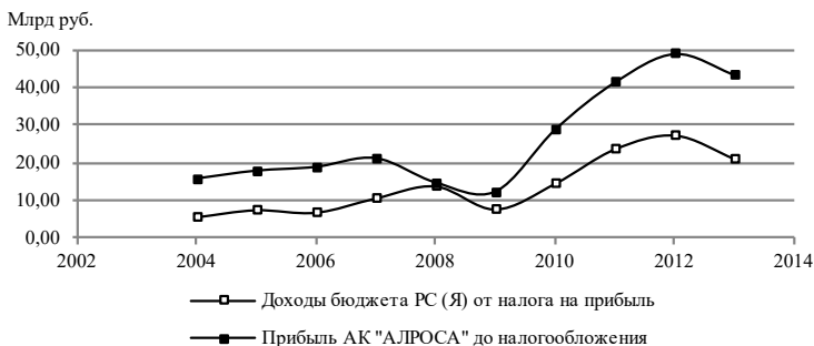
Рис. 1. Динамика доходов бюджета Республики Саха (Якутия) от налога на прибыль и прибыли АК «АЛРОСА» за 2003–2014 гг., млрд руб.

Графический анализ динамики величины прибыли АК «АЛРОСА» и доходов бюджета Республики Саха от налога на прибыль организаций в период с 2003 по 2013 гг. показывает наличие сильной корреляции между данными показателями (рис. 1). Траектория кривой «доходы бюджета от налога на прибыль» практически повторяет траекторию кривой «прибыль до налогообложения».